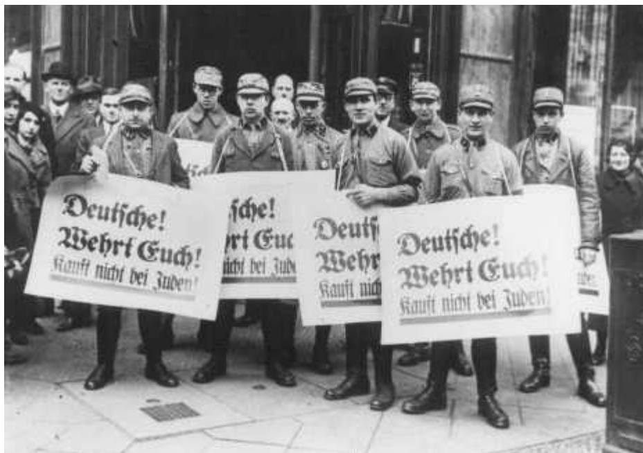
Fotografia tirada durante um boicote aos judeus. Nas placas está escrito: “Alemães! Se defendam! Não comprem de judeus.”. Berlim, Alemanha, 1933.