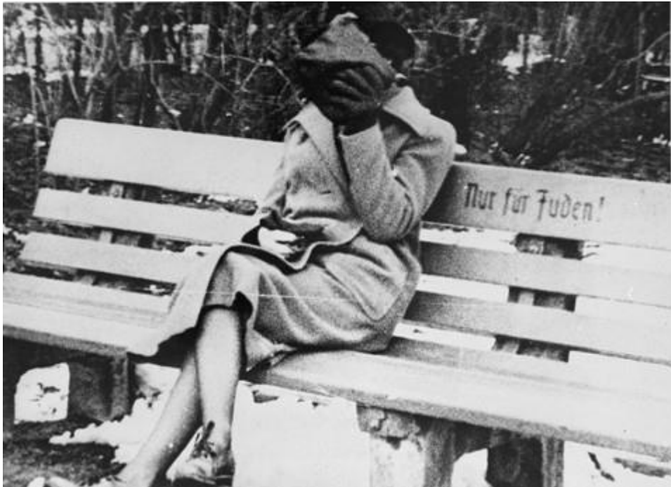
Mulher sentada num banco onde está escrito “somente para judeus”. Áustria, 1938.