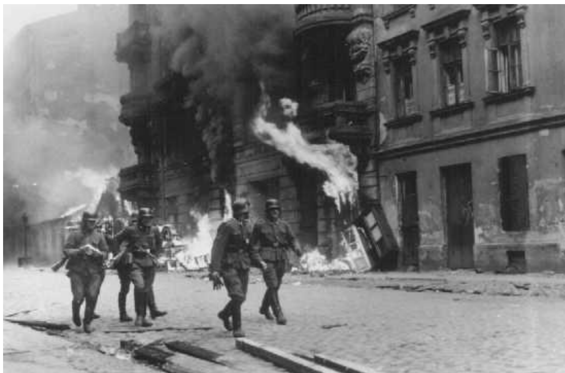
Soldados alemães queimando as residências judaicas no Gueto. Varsóvia, Polônia, 1943.