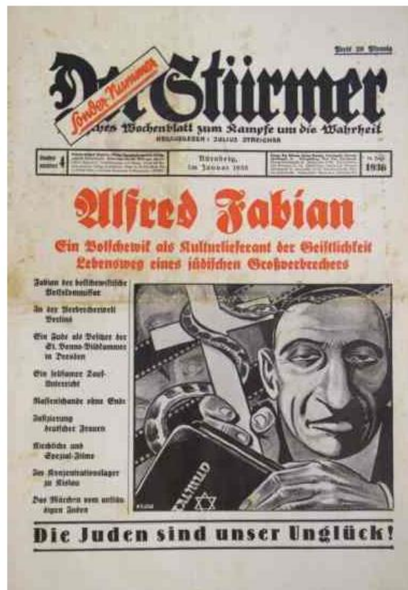
Der Stürmer Antisemitische Zeitung Herausgeber: Julius Streicher 44,8 x 32,2 cm Nürnberg, Januar 1936 DHM, Berlin 1990/5214