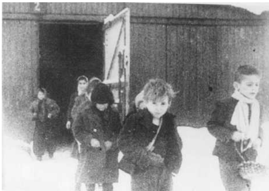
Crianças sobreviventes sendo liberadas de Auschwitz. Polônia, 1945.