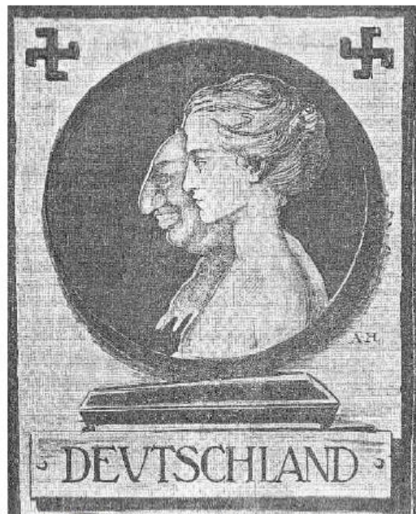
Wahlplakat zur Reichstagswahl (1920)