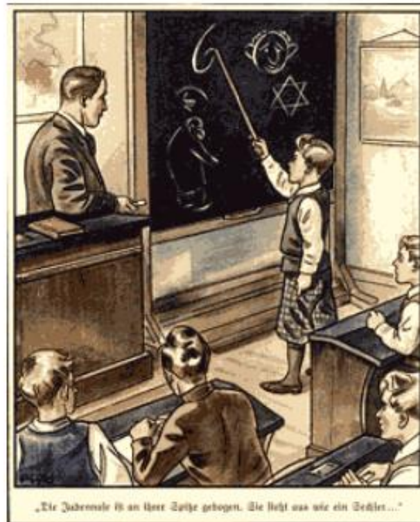
"Die Judennase ist an ihrer Spitze gebogen. Sie sieht aus wie ein Sechser..."