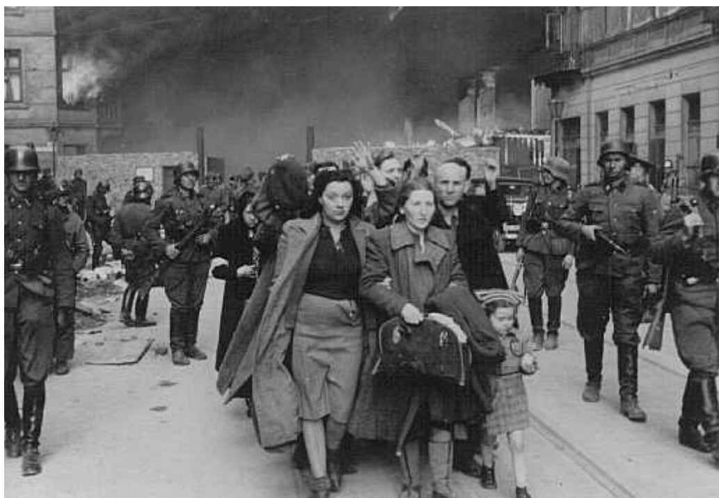
Judeus sendo capturados pelos soldados alemães no gueto. Varsóvia, Polônia, 1943.