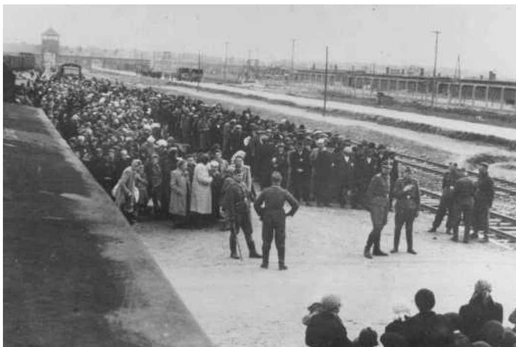
Prisioneiros húngaros judeus chegando a Auschwitz. Polônia, 1944.