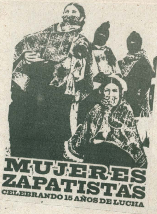
Cartaz dos 15 anos de luta das Mulheres Zapatistas.